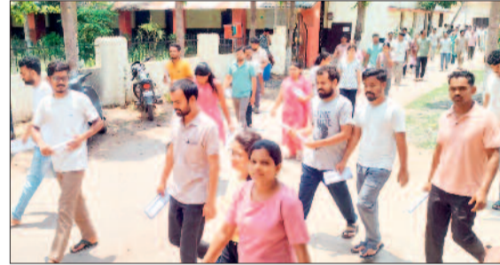
हरिभूमि न्यूज | जगदलपुर

व्यावसायिक परीक्षा मण्डल द्वारा आयोजित मंडी उप निरीक्षक भर्ती परीक्षा रविवार को जिले में जिला प्रशासन की कड़ी निगरानी और सुरक्षा व्यवस्थाओं के बीच कड़े सुरक्षा घेरे में 7662 परीक्षार्थियों ने परीक्षा दी। परीक्षा के पहले गेट में ही दो दर्जन अभ्यर्थियों के आस्टीन काटे गए, गेट ताला बंद होने के बाद लगभग 15 अभ्यर्थियों को बिना परीक्षा दिए ही बैरंग वापस जाना पड़ा। इसी से से कोण्डागांव से महिला परीक्षार्थी बस से जगदलपुर पहुंचने में 5 मिनट विलंब होने के चलते परीक्षा में प्रवेश नहीं मिला। प्रत्येक परीक्षा