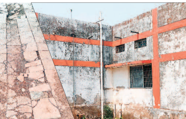
के अंदर जाने से पहले ही टाइल्स टूट गया है। मंडी परिसर का निर्माण कार्य में गोदामों की

लगभग साढ़े 5 वर्षों में मंडी कार्यालय भवन निर्माण हो गया, जिससे पदस्थ कर्मों दुर्घटना संभावना के दशहत् में रहते हैं। कार्यालय भवन की दीवारों में दरारें हो गईं और कार्यालय